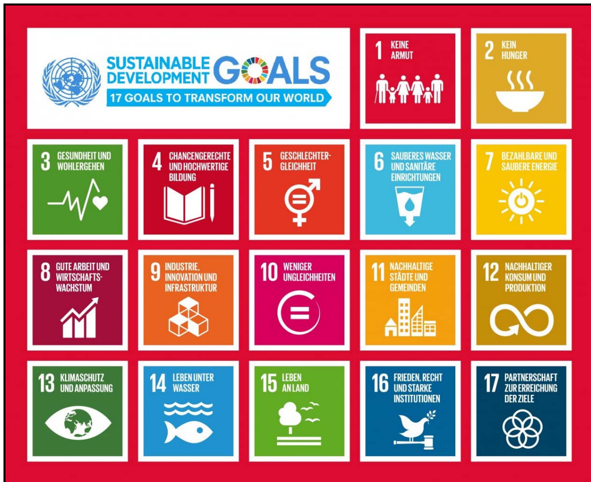
Abb. 2 „17 UN-SDG“ @ https://www.unesco.de

Eine ESG-Nachhaltigkeitsberichterstattung lässt sich schnell wie schlüssig am besten anhand der 17 Ziele der UN zu einer nachhaltigen Entwicklung erklären, da diese den interdisziplinären Ansatz von Nachhaltigkeit sehr anschaulich belegen. Die Offenlegung der eigenen Nachhaltigkeitsaktivitäten gegenüber dem zuvor genannten externen Kreis erhält zunehmend Relevanz (Stichwort: CSR-Berichtspflicht), kann aber zukünftig auch ein entscheidender Wettbewerbsfaktor werden.