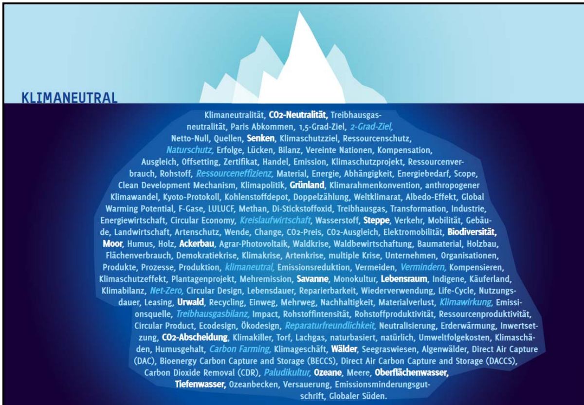
Abb. 3 „interdisziplinäres Ineinandergreifen von ESG & Klimaneutralität“

Der Weg zur Klimaneutralität ist interdisziplinär, und es werden wie in Abb. 3 explizit dargestellt, die unterschiedlichsten Bereiche des eigenen wirtschaftlichen Handelns und Schaffens – teils auch interagierend – berührt.